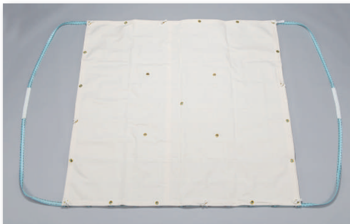
モッコ+別売リシート：脱着式帆布(綿)